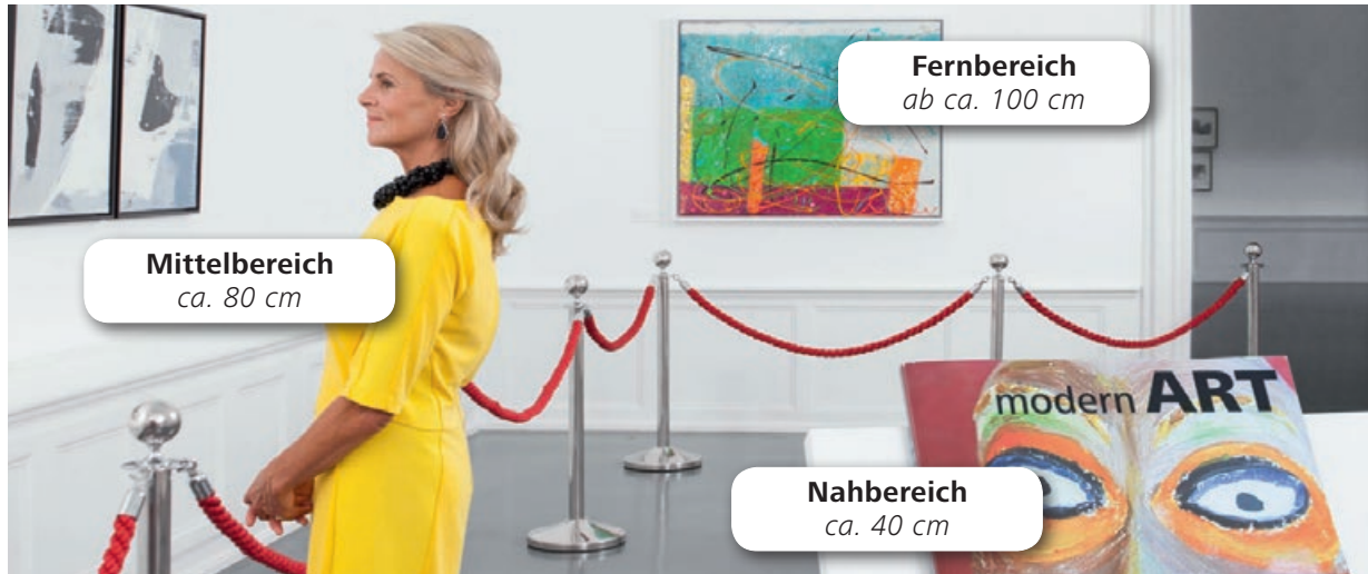
Simulierte Sicht mit einer trifokalen Linse: scharfes Sehen im Fern-, Mittel- und Nahbereich

Trifokale Linsen ermöglichen nicht nur scharfes Sehen im Fernbereich und angenehmes Lesen im Nahbereich. Dieser IOL-Linsentypus erlaubt auch gutes Sehen im mittleren Sehabstand, was gerade bei alltäglichen Tätigkeiten extrem wichtig ist, zum Beispiel beim Kochen oder bei der Bildschirmarbeit. Als Folge benötigen viele Patienten mit trifokalen Linsen tatsächlich keine Brille mehr.