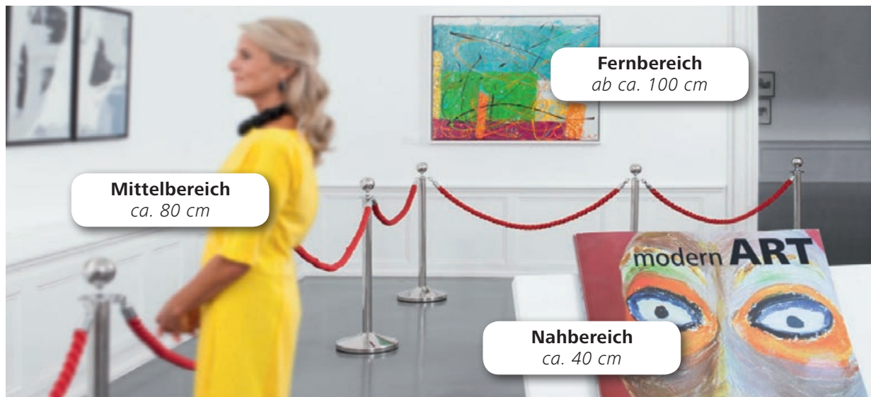
Simulierte Sicht mit einer bifokalen Linse: scharfes Sehen im Fern- und Nahbereich

Ähnlich wie bifokale Brillen vereinen bifokale Intraokularlinsen zwei Fokuspunkte, die scharfes Sehen sowohl in der Ferne als auch in der Nähe ermöglichen. Patienten, bei denen bifokale IOL eingesetzt werden, benötigen eventuell eine Brille für spezielle Tätigkeiten im mittleren Sehbereich (ca. 80 cm), wie bei der Arbeit am Computer.