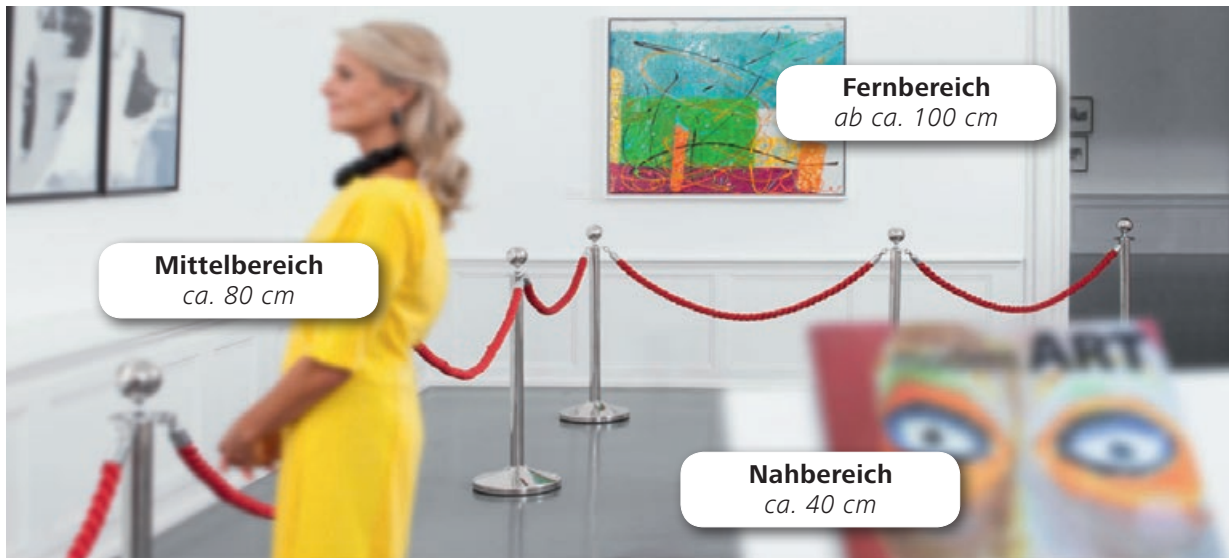
Simulierte Sicht mit einer monofokalen Linse: scharfes Sehen in der Ferne

Die am häufigsten eingesetzten Intraokularlinsen haben eine monofokale Optik mit einer einzigen Korrekturstärke (Fokuspunkt). Diese Einstärken-Linsen ermöglichen gutes Sehen auf eine Distanz, meistens in der Ferne, was zum Beispiel beim Autofahren wichtig ist. Mit monofokalen IOL benötigen Patienten jedoch für Tätigkeiten in anderen Entfernungsbereichen, wie zum Beispiel Lesen, weiterhin eine Brille.